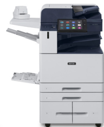
Multifuncionais Xerox® AltaLink® B8145/B8155/B8170

* Produto não disponível em todas as regiões, consulte o seu representante de vendas.