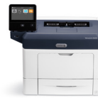
Impressora Xerox® VersaLink® B400