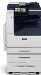
Multifuncionais Xerox® VersaLink® B7125/B7130/ B7135