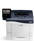
Impressora colorida Xerox® VersaLink® C400