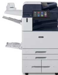
Multifuncionais coloridas Xerox® AltaLink® C8130/ C8135/C8145/ C8155/C8170