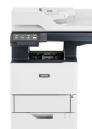
Multifuncional Xerox® VersaLink® B625*