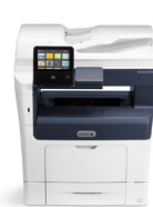
Multifuncional Xerox® VersaLink® B405