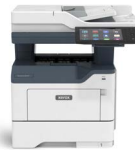
Xerox® VersaLink® B415 multifunksjonskriver