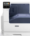
Xerox® VersaLink® C7000 fargeskriver