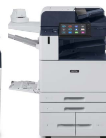
Xerox® AltaLink® B8145/B8155/B8170 multifunksjonsskriver

*Produktet er ikke tilgjengelig i alle geografiske områder, vennligst ta kontakt med din salgsrepresentant.