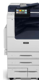
Xerox® VersaLink® B7125/B7130/B7135 Multifunksjonskriver