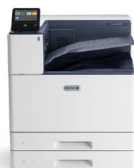
Xerox® VersaLink® C8000 fargeskriver