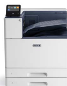
Xerox® VersaLink® C9000 fargeskriver