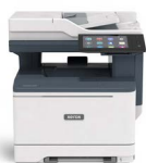
Xerox® VersaLink® C415 fargemultifunksjonskriver