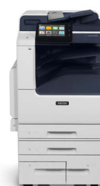
Xerox® VersaLink® B7125/B7130/ B7135 multifunktions- printer