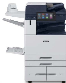
Xerox® AltaLink® C8130/C8135/ C8145/C8155/ C8170 multifunktions- farveprinter