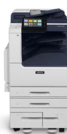
Xerox® VersaLink® C7120/C7125/ C7130 multifunktions- farveprinter