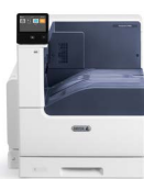
Xerox® VersaLink® C7000- farveprinter