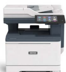
Xerox® VersaLink® C415- multifunktions farveprinter