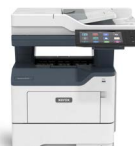
Xerox® VersaLink® B415- multifunktions printer