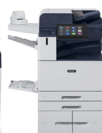
Xerox® AltaLink® B8145/B8155/ B8170 multifunktions printer

* Produktet er ikke tilgængeligt i alle områder. Spørg din salgsrepræsentant til råds.