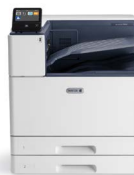
Xerox® VersaLink® C9000- farveprinter