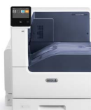
Imprimanta color Xerox® VersaLink® C7000