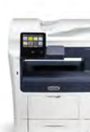
Impressora Multifuncional Xerox® VersaLink® B405