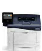
Impressora a Cores Xerox® VersaLink® C400