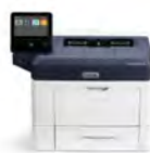
Impressora Xerox® VersaLink® B400