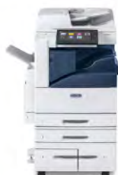
Impressora Multifuncional a Cores Xerox® AltaLink® C8030/C8035/C8045/ C8055/C8070