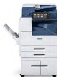
Impressora Multifuncional Xerox® AltaLink® B8045/ 8055/8065/8075/8090