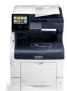
Impressora Multifuncional a Cores Xerox® VersaLink® C405