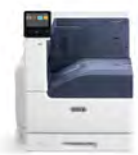
Impressora a Cores Xerox® VersaLink® C7000