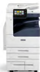
Impressora Multifuncional a Cores Xerox® VersaLink® C7020/C7025/C7030