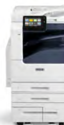
Impressora Multifuncional Xerox® VersaLink® B7025/B7030/B7035