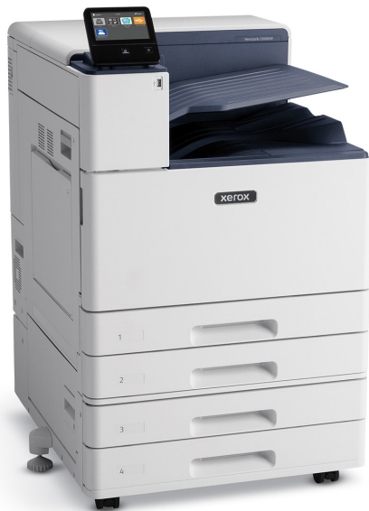
VersaLink® C8000W med tvåmagasinsmodul