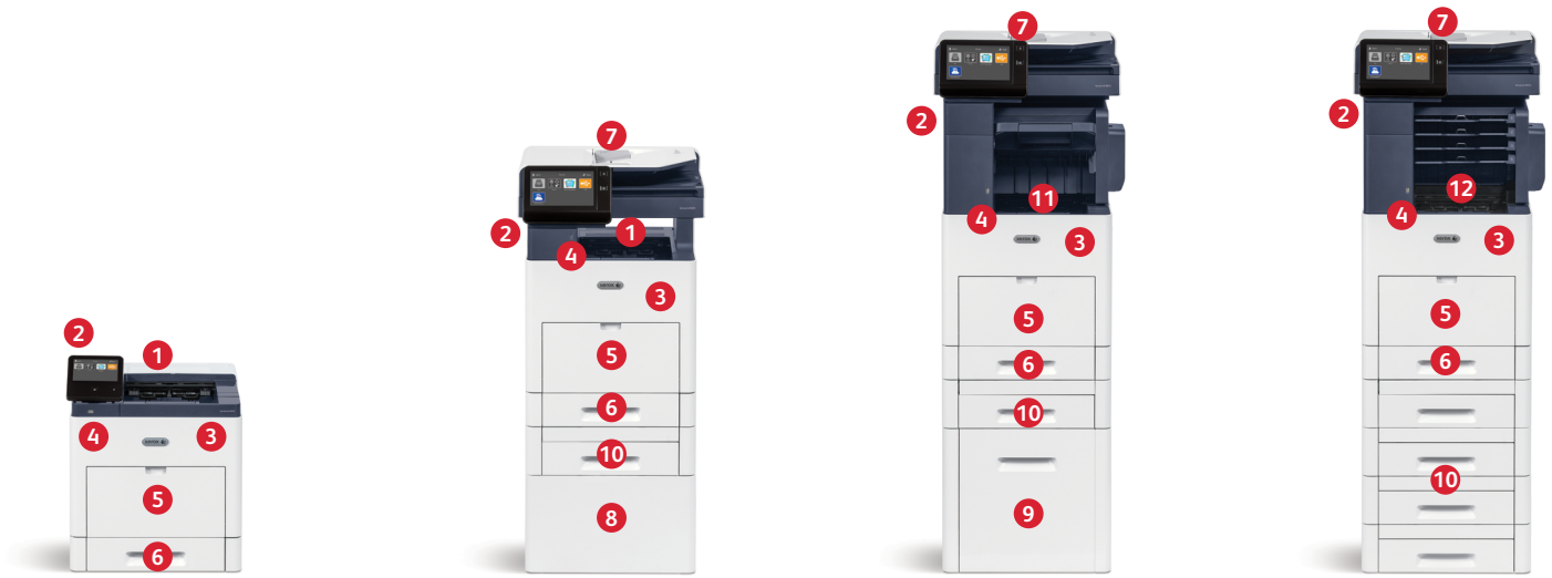
Xerox® VersaLink® C600 -väritulostin Tulostus. Mobiiliiliitännät.