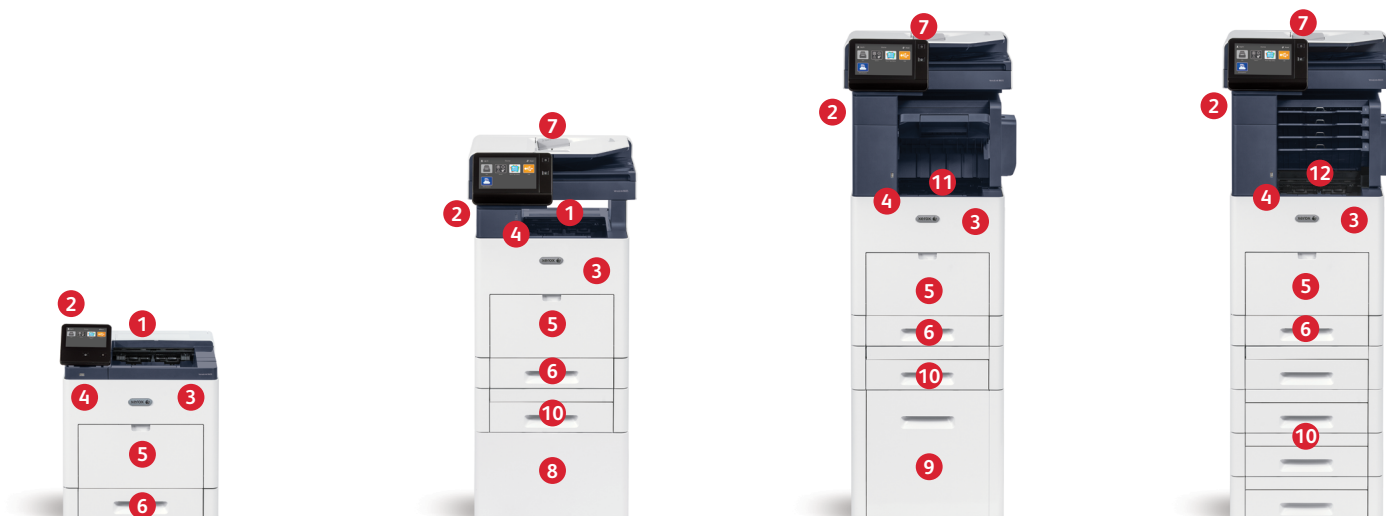
Imprimante couleur Xerox® VersaLink® C600 Impression. Connectivité mobile.