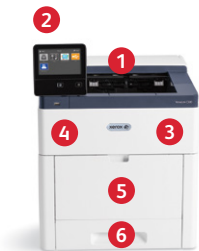
Imprimante couleur Xerox® VersaLink® C500 Impression.