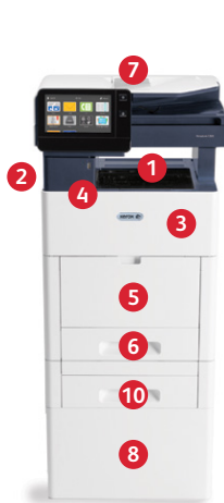
Imprimante multifonctions couleur Xerox® VersaLink® C505 Impression. Copie. Numérisation. Télécopie. Courrier électronique.