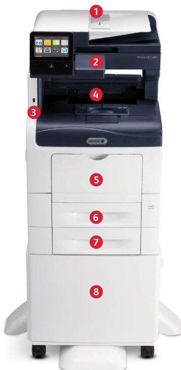
Xerox® VersaLink® C405 multifunktionsfärgskrivare Skriv ut. Kopiera. Skanna. Faxe. Skicka e-post.