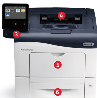
Xerox® VersaLink® C400 färgskrivare Skriv ut.