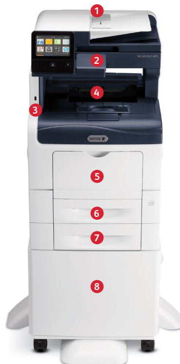
Impresora multifunción a color Xerox® VersaLink® C405 Impresión. Copiado. Escaneado. Fax. Correo electrónico.