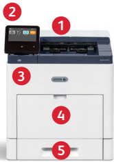
Impressora Xerox® VersaLink® B610 Imprima.