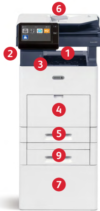
Impressora Multifuncional Xerox® VersaLink® B615 Imprima. Copie. Digitalize. Fax. E-mail.