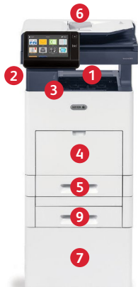
Xerox® VersaLink® B605 -monitoimitulostin Tulostus. Kopiointi. Skannaus. Faksi. Sähköposti.