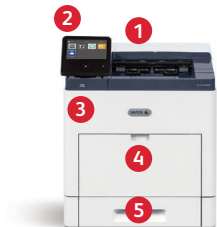
Xerox® VersaLink® B600 -tulostin Tulostus.