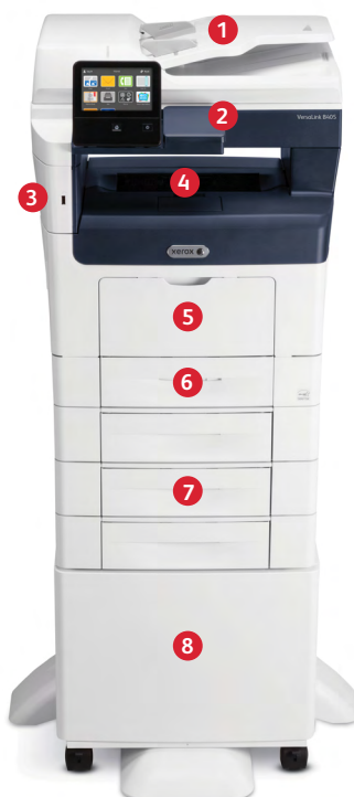
Xerox® VersaLink® B405 többfunkciós nyomtató Nyomtat. Másol. Szkennel. Faxol. E-mailt küld.