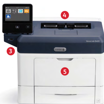
Xerox® VersaLink® B400 nyomtató Nyomtatás.