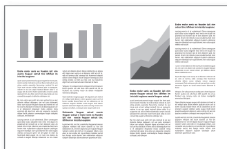
1 Página a Preto e Branco com 2 páginas numa folha do MS Outlook