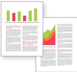
MS Outlook 2 Seiten in Farbe