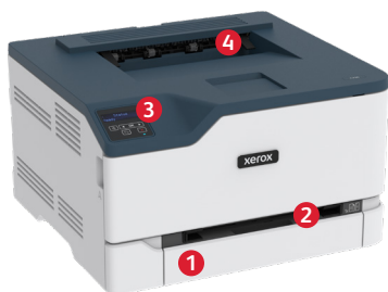
Цветной принтер Xerox® C230