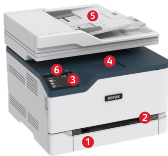
Xerox® C235 multifargeskriver