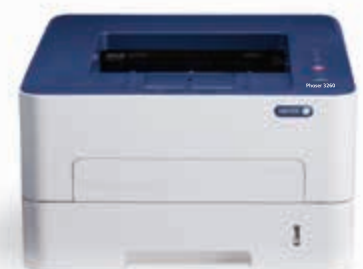
Phaser 3260. Imprimare.