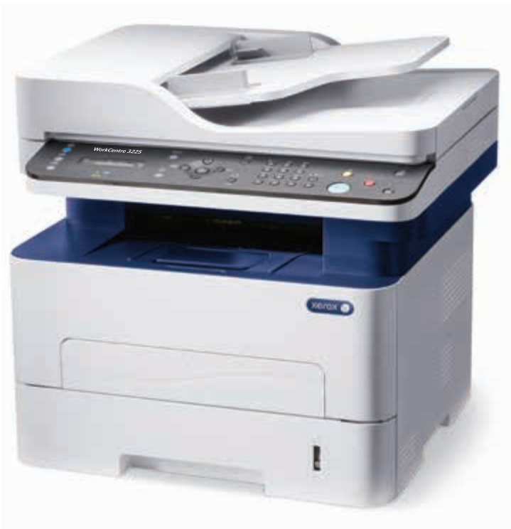
WorkCentre 3225. Copiere. Imprimare. Scanare. Fax. E-mail.