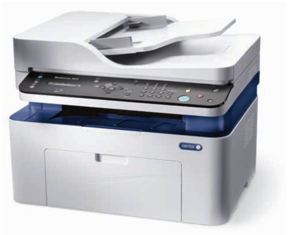
WorkCentre 3025. Másol. Nyomtat. Szkennel. Faxol.*

* A fax és az ADF csak a WorkCentre 3025NI készüléken érhető el.